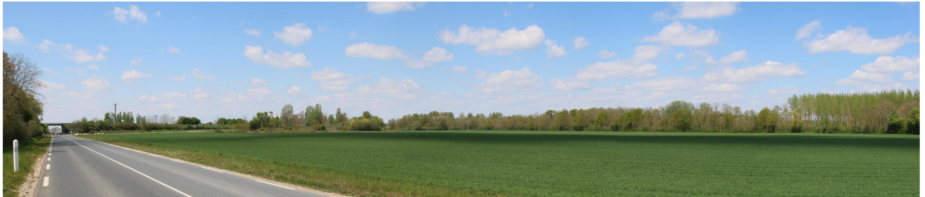
Photomontage n°3 – depuis la D16, à l’Ouest de la ripisylve du ruisseau de Gercourt