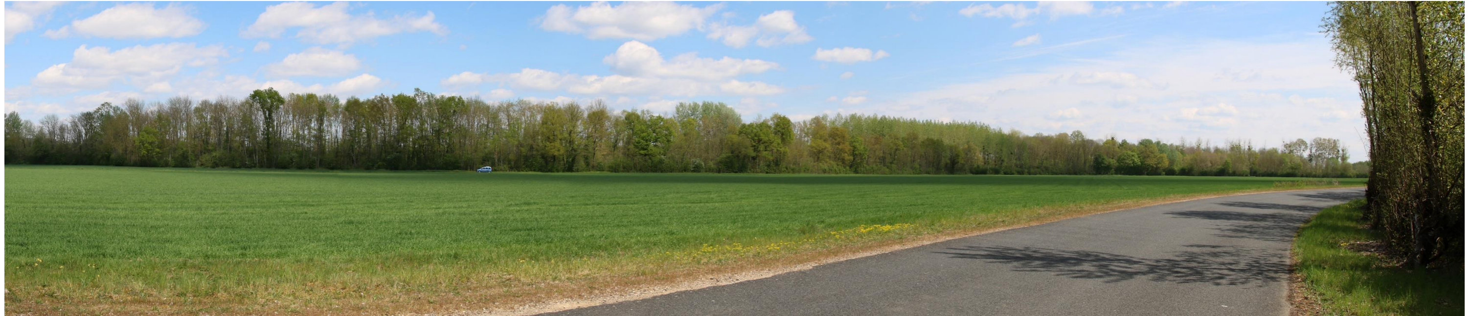
Photomontage n°1 – depuis la route communale à l’Ouest du projet (Les haies prévues dans le cadre des mesures paysagères ne sont pas représentées sur ce photomontage Elles sont visibles en page 196, photo 46 du PC11)